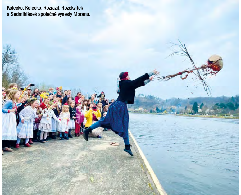
Kolečko, Kolečko, Rozrazil, Rozekvítek a Sedmihlásek společně vynesly Moranu.

Přemýšleli jste v poslední době, že by bylo načase posunout zas o něco dál vaše ukulele dovednosti? Pokud ano i pokud zrovna ne, zveme vás na květnovou ukulele dílnu pro mírně pokročilé. Dílna proběhne v pondělí 13. 5. od 13.30 do 17. 00. Vlastní ukulele se hodí, ale není podmínkou, pár jich bude k zapůjčení na místě. Přihlašování na webu Roztoče.