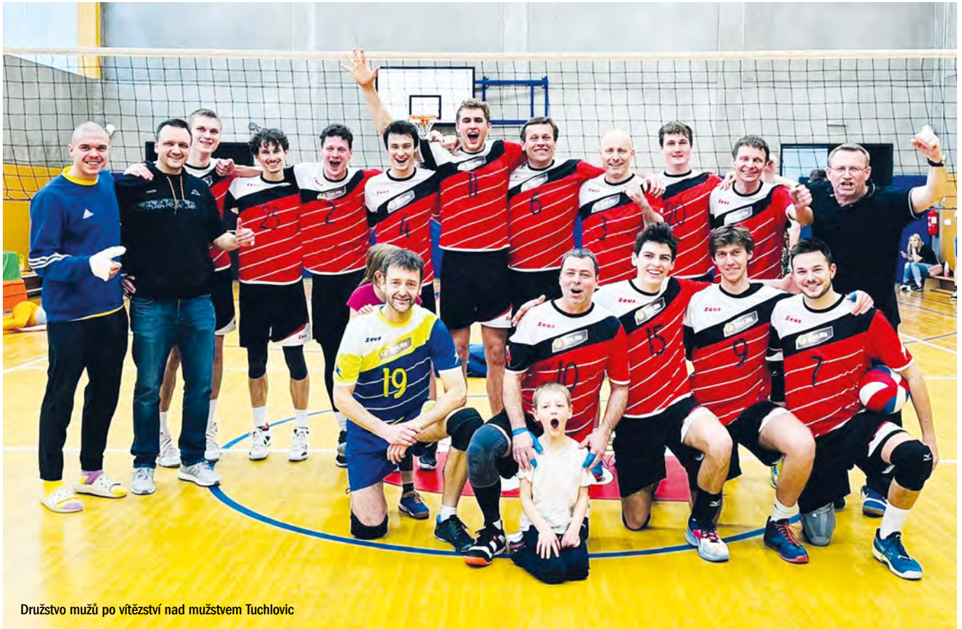
Družstvo mužů po vítězství nad mužstvem Tuchlovic

Hráči a hráčky TJ Sokola Rožtoky měli v této sezóně rozdílnou trajektorii výsledků.