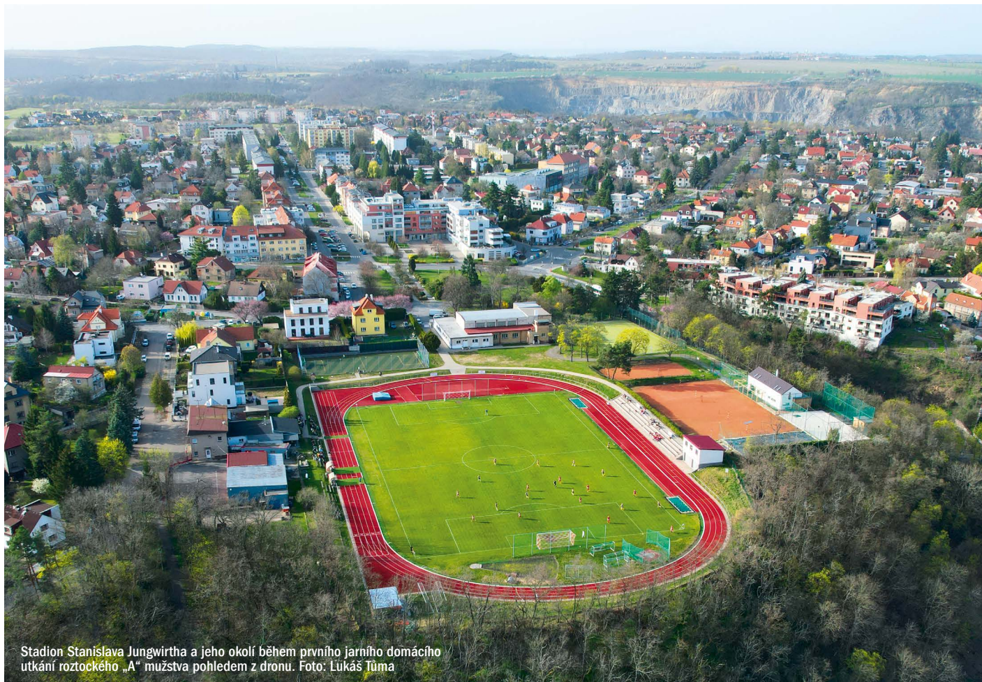
Stadion Stanislava Jungwirtha a jeho okolí během prvního jarního domácího utkání roztockého „A“ mužstva pohledem z dronu.