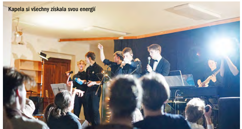
Kapela si všechny získala svou energií