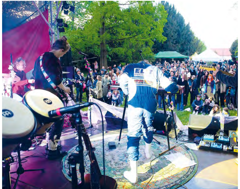
Stejně jako minulý rok nás čeká bohatý hudební program

Na své si přijdou i ti nejmenší návštěvníci a návštěvnice se svým doprovodem. Amálka K. Třebická zazpívá písně ze své desky v představení Nešišlej! Album vznikalo na popud logopedky, ale nemá ambice odborného materiálu, je míněno jako doplněk pro všechny malé děti k často tak úmornému procvičování případných problematických hlásek.