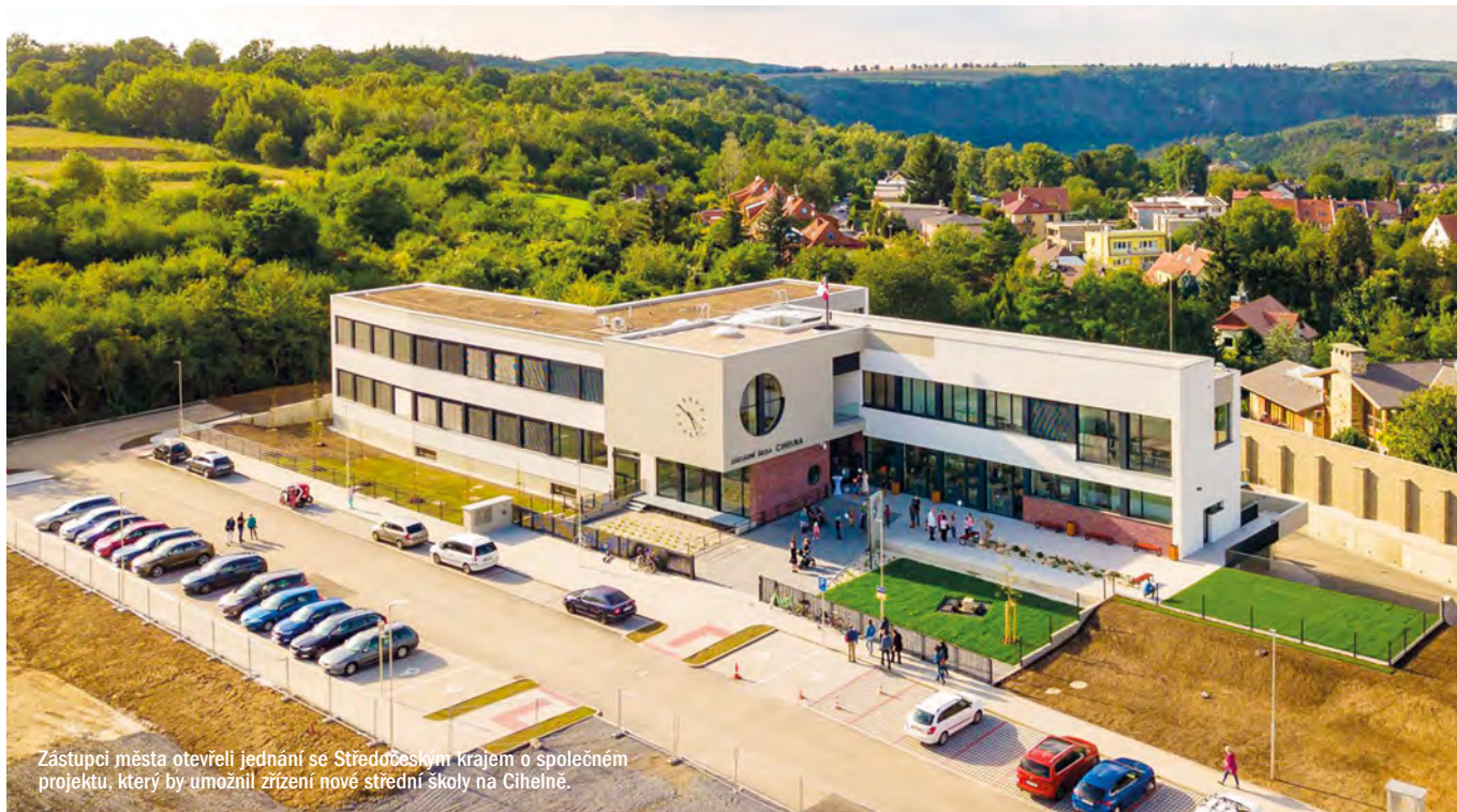
Zástupci města otevřeli jednání se Středočeským krajem o společném projektu, který by umožnil zřízení nové střední školy na Cihelně.

V Roztokách se rýsuje budoucnost místního školství v novém světle. Nedávná jednání mezi zástupci města a Středočeského kraje naznačují krok vpřed ke zřízení dlouho poptávané střední školy.