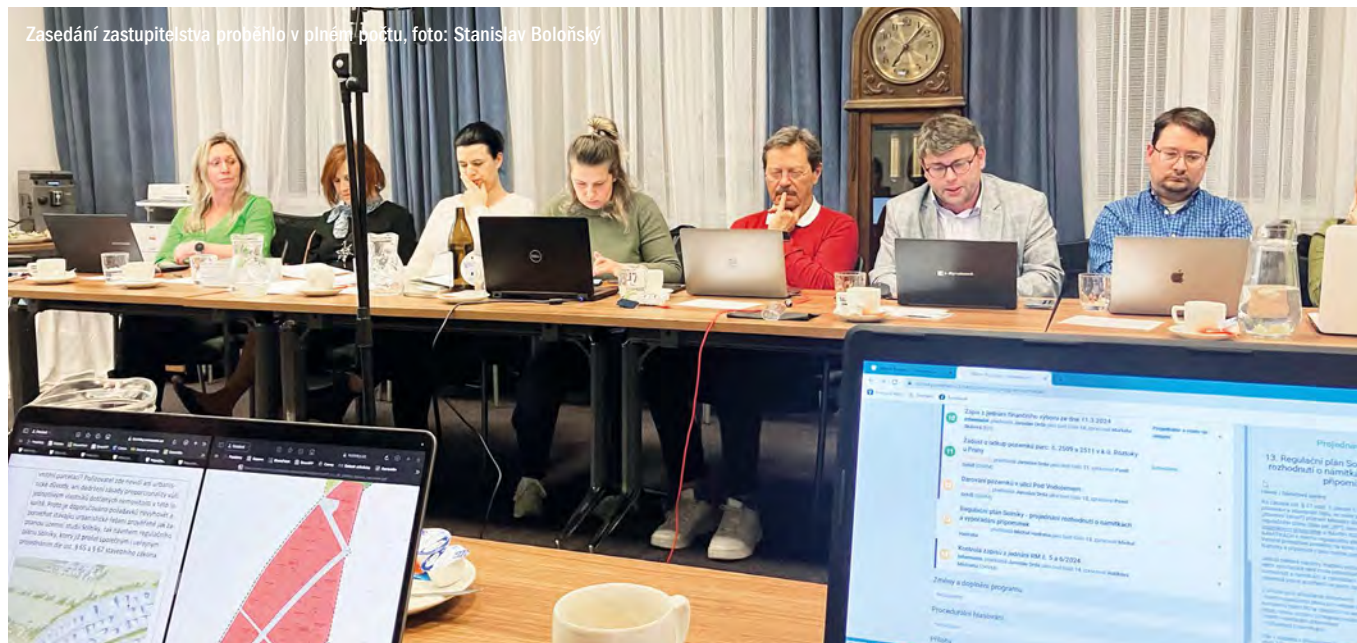
Zasedání zastupitelstva proběhlo v plném počtu

Březnové zasedání zastupitelstva pokračovalo v trendu relativně krátkých a hladkých jednání z poslední doby. V době jeho zahájení bylo přítomno 18 zastupitelů a zastupitelů, ale v průběhu zasedání dorazili i opozdilci, takže nakonec se zasedání konalo v plném počtu.