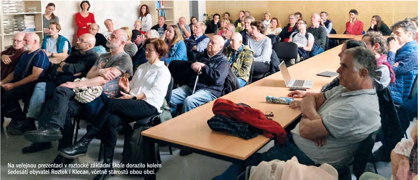
Na veřejnou prezentaci v roztocké základní škole dorazilo kolem šedesáti obyvatel Roztok i Klecan, včetně starostů obou obcí.

Mezi přítomnými byli příznivci i odpůrci lávky z obou břehů. Ačkoliv příznivců byla většina, je třeba brát námitky a obavy odpůrců či více zdrženlivých zcela vážně a hledat řešení.