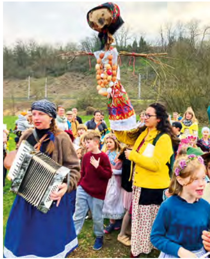
21. března jsme vynesli, zapálili a utopili Moranu.

Na avizovaném Dni otevřených dveří v pondělí 25. 3. se sešlo na 30 rodin. Zájemci si prohlédli školu, seznámili se