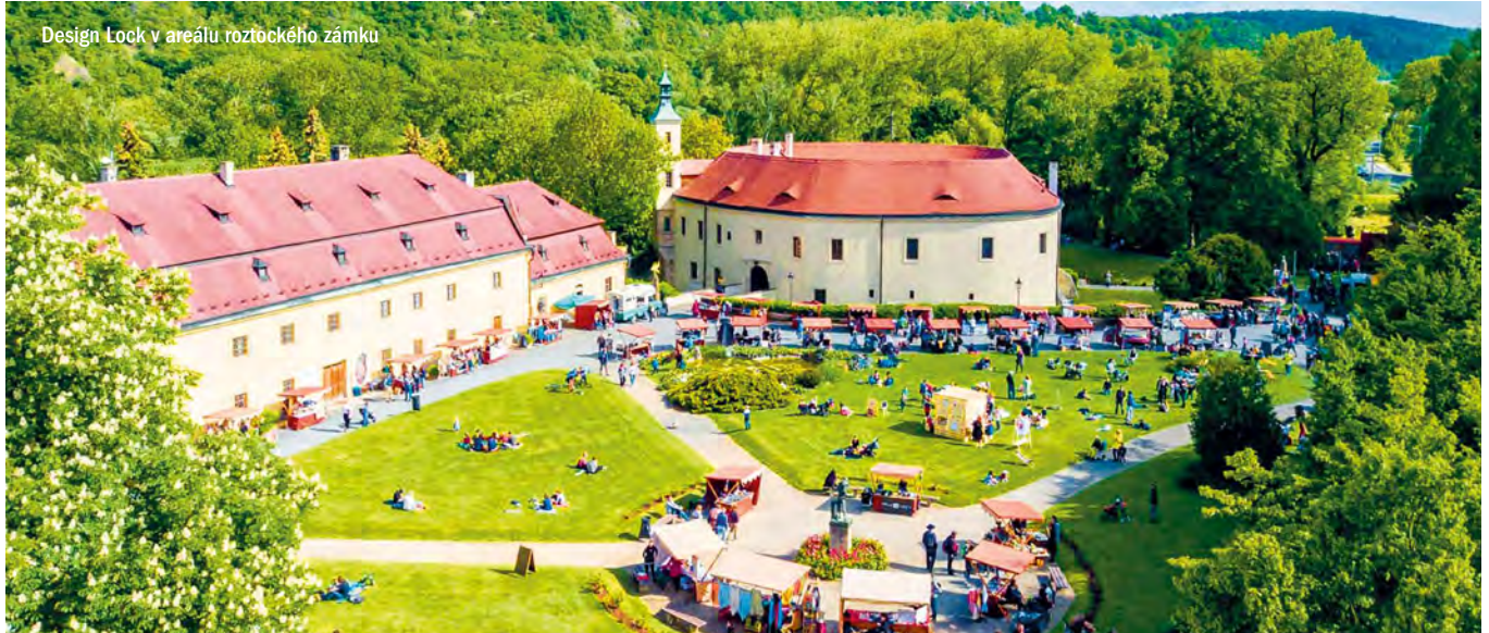
Design Lock v areálu roztockého zámku

blíbený roztocký design a handmade market DESIGN LOCK se vrací! Vedle více než 80 stánků s originální autorskou módou, šperky, kosmetikou, doplňky a skvělým streetfoodem přichází i s bohatým programem pro děti i dospělé, který slibuje nezapomenutelný zážitek pro celou rodinu. DESIGN LOCK jaro se koná v neděli 26. května v prostředí malebného zámku v Roztokách.