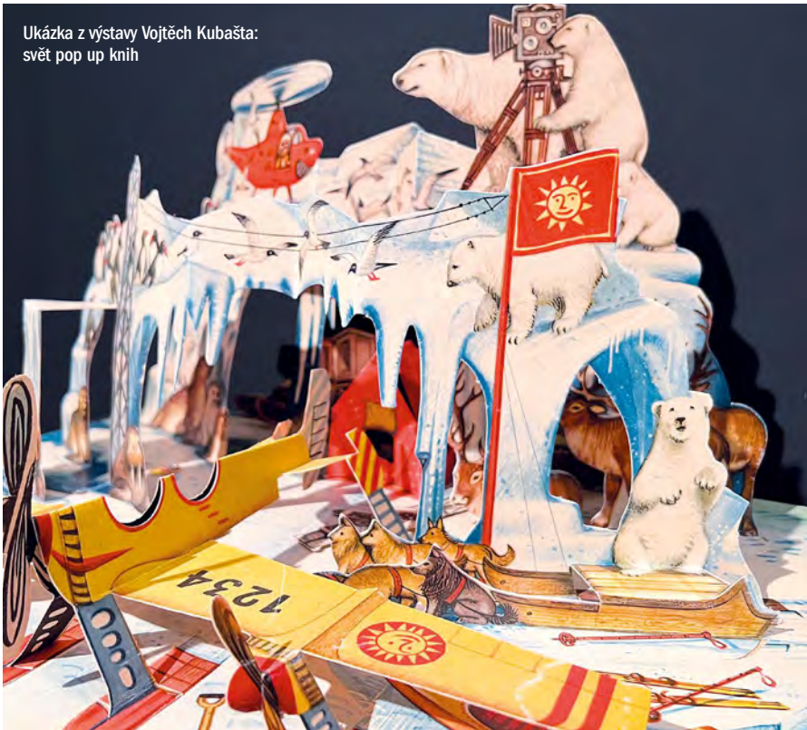
Ukázka z výstavy Vojtěch Kubašta: svět pop up knih

S větově proslulý ilustrátor a tvůrce dětských 3D knih, někdy označovaný jako „papírový inženýr“ a „knižní konstruktér“, se narodil 7. října 1914 ve Vídni v české rodině, ale skoro celý život prožil v Praze. Vystudoval zde architekturu, které se pak také krátce věnoval. Navrhoval nejen budovy a interiéry, ale také scénografie pro loutkové divadlo. Mimořádné umělecké nadání, výborný cit pro prostor a bohaté technické zkušenosti přivedly Kubaštu až k navrhování prostorových pohyblivých (tzv. pop-up) knih i jejich ilustrování. Během svého života vytvořil několik desítek knih, ve kterých jedinečným způsobem ztvárnil klasické pohádky i dobrodružné příběhy. Jeho styl nemá obdoby, princip trojrozměrných pohyblivých knih (autor sám je pracovním nazýval „ýbačky“) neustále zdokonaloval a vynalézal čím dál důmyslnější mechanismy. Leporelo přestávalo být pouhou knihou a stávalo se spíše hračkou, jakýmsi miniaturním divadélkem. Kubašta se stal jed-