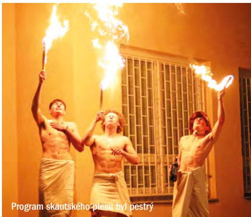
Program skautského plesu byl pestrý

Účast na letošním plese předčila naše očekávání a máme z ní velkou radost. Přišlo přes 200 lidí, nechyběli mezi nimi naši členové napříč generacemi, rodiče, přátelé, známí a veřejnost z Rostok i okolí.