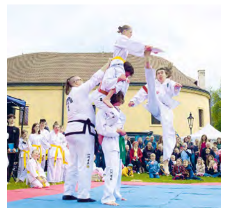
Exhibice taekwonda na loňském ročníku

Všem návštěvníkům a návštěvnicím přijemnou náladu hudbou Douglas Arellanes, DJ a moderátor z pražské rozhlasové stanice Radio 1. Na festivalu nebude opět chybět ani chutné občerstvení.